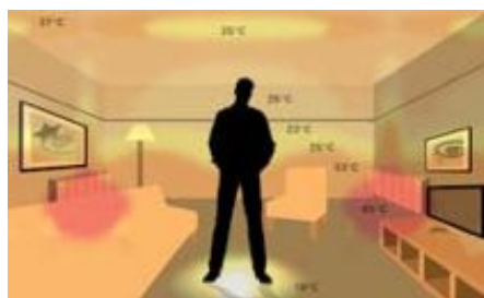
Rozloženie teplôt pri použití tradičného vykurovacieho systému s radiátormi. Veľké rozdiely teplôt v miestnosti (18 – 65°C).

Tradičné nástenné vykurovacie telesá ohrievajú vzduch vo svojom najbližšom okolí, ktorý následne stúpa ku stropu. Podlahové vykurovanie Raychem zaisťuje rovnomerné šírenie tepla v celej miestnosti, pričom najteplejšia zóna sa nachádza presne tam, kde je to potrebné.