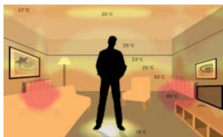
Rozloženie teplôt pri používaní tradičného vykurovacieho systému s radiátormi. Veľké rozdiely teplôt v miestnosti (18 – 65°C).

Tradičné nástenné vykurovacie telesá ohrievajú vzduch vo svojom najbližšom okolí, ktorý následne stúpa ku stropu. Podlahové kúrenie Raychem zaisťuje rovnomerné šírenie tepla v celej miestnosti, pričom najteplejšia zóna sa nachádza presne tam, kde je to potrebné.